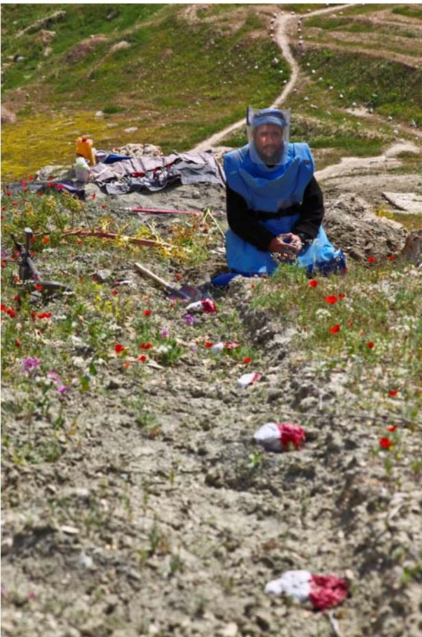
عملیات ماین پاکی در ولایت سمنگان

پروگرام ماین پاکی بشری در سال ۱۳۶۸ در افغانستان به وجود آمد و تمام ارکان ماین پاکی را در بر میگیرد که شامل تبلیغات ، سروی ، پاکسازی، از بین بردن انبارهای ماین ، تعلیمات آگاهی از خطرات ماین و مساعدت با قربانیان ماین میباشد. پروگرام ماین پاکی افغانستان از طریق صندوق وجهی ملل متحد و دیگر بودیجه های دوجانبه و چندین جانبه تمویل میگردد.