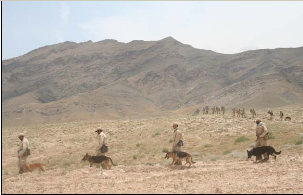
تیم های ماین پاکی MDD در ولسوالی چهارآسیاب در حال بازگشت از عملیات پاکسازی ماین ها / جون 2009

مرکز هم آهنگی امور ماین پاکی افغانستان که توسط ملل متحد حمایت میگردد ، از طریق ریاست تطهیر ماین ( DMC ) مربوط اداره ملی آمادگی مبارزه با حوادث ( ANDMA ) تشریک مساعی مینمایند تا امور پلان گذاری ، هم آهنگی و کیفیت فعالیت های پاکسازی ماین ها را در افغانستان تامین نمایند. مجلس اخیر شورای بین وزارت ها در ماه مارچ راه اندازی گردید که به شمول موضوع مس عینک موضوعات کلیدی دیگر به بحث گرفته شد و معلومات در بین وزارت ها شریک گردید.